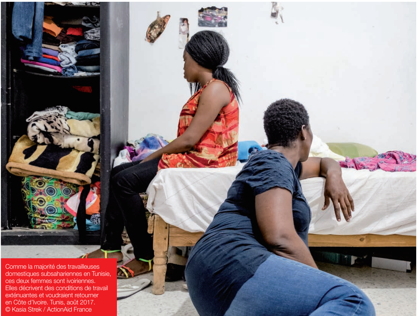
Comme la majorité des travailleuses domestiques subsahariennes en Tunisie, ces deux femmes sont ivoiriennes. Elles décrivent des conditions de travail exténuantes et voudraient retourner en Côte d'Ivoire. Tunis, août 2017.

Pour conclure, les stratégies de protection et d'amélioration des conditions de travail restent toujours dans un cadre informel et varient en fonction du parcours ; elles sont donc fragiles et aléatoires.