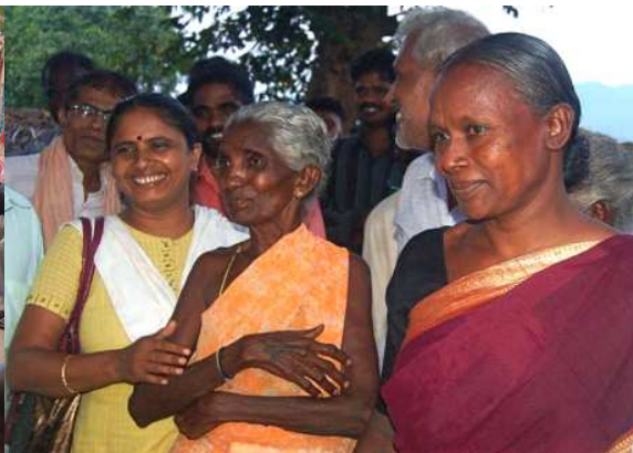
Des personnes ayant participé aux luttes

Au Kerala , la YATRA a visité Plachimada, lieu célèbre pour avoir contribué à la fermeture d'une usine Coca-Cola. Le président du comité de lutte a parlé des effets qu'ont les corporations comme Coca-Cola sur l'écologie, la biodiversité et les ressources des personnes vivant autour de l'usine d'embouteillage (ex : pollution de l'eau, baisse des ventes de noix de coco, dégradation des cultures de tubercules, sécheresse). Il a ajouté que le gouvernement avait l'obligation de protéger les sources d'eau des villages, et que le comité était contre les contrats qui donnent aux entreprises des droits sur les ressources en eau.