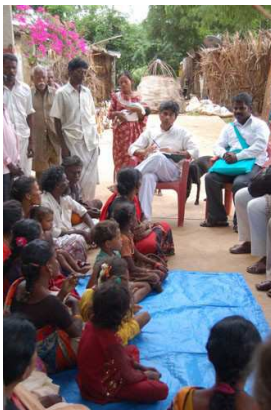
Visite dans un village Adivasi au Tamil Nadu

Le premier jour, la Yatra a mené une action symbolique : elle s'est rendue à Koodankulam dans le Kerala pour visiter un rassemblement contre un projet de centrale nucléaire. Les manifestants craignent les conséquences de ce projet, comme l'expulsion de leurs terres, l'émission de radiations (déjà élevées dans la région), la pollution de l'eau qui affecte les moyens de subsistance des petits pêcheurs ou les risques d'accidents.... Des milliers de personnes sont venues à la manifestation, 100 personnes sont en grève de la faim, et la situation a des échos dans tout le Sud de l'Inde.