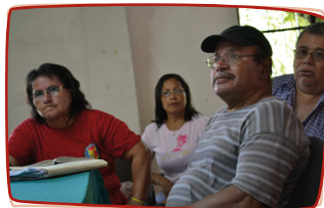
Réunion intersyndicale pour le secteur de la banane au Costa Rica, mai 2011