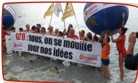
Le 2 novembre 2011, nos militants se mouillent pour leurs idées.

Sans l'investissement fort des signataires et des groupes locaux de Peuples Solidaires, rien de tout cela n'aurait été possible. Cette campagne nous a permis de sensibiliser les citoyen-ne-s aux défis de l'agriculture et de l'alimentation et de positionner Peuples Solidaires/ActionAid comme un acteur important