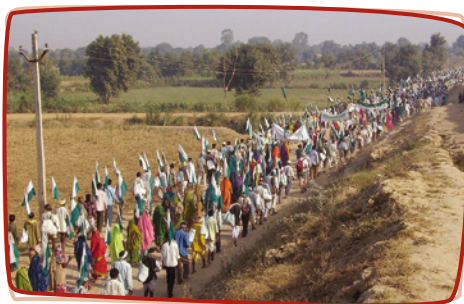
Grande Marche « Janadesh 2007 »

Depuis le lancement de l'Appel Urgent n°348 du 3 octobre 2011, près de 6000 signatures ont été collectées, avec un impact significatif sur nos député-e-s qui ont relayé les revendications du mouvement Ekta Parishad auprès du ministère des Affaires étrangères français, de l'ambassade d'Inde, et même du Premier ministre indien. Tout ceci est donc de très bon augure pour la suite de la campagne, qui ne fait que commencer! En Inde, une cinquantaine de membres d'Ekta Parishad, dont son leader Rajagopal, sont partis comme prévu le 2 octobre du Sud de l'Inde pour une longue marche d'un an (Jan Samwad Yatra), et sont maintenant dans la province du Maharashtra, en vue de la préparation de la grande marche d'octobre 2012 (Jan Satyagraha). En France, Peuples Solidaires accueillera en mars une représentante d'Ekta Mahila Manch, branche féminine d'Ekta Parishad, qui participera à des conférences-débats à travers la France. En mai, une marche décentralisée aura lieu partout en France à l'initiative des