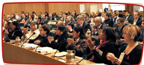
Forum Mondial de la banane

Le Forum mondial de la banane, créé en 2009 sous l'égide de la FAO (Organisation des Nations unies pour l'alimentation et l'agriculture) réunit l'ensemble des acteurs de la filière banane. Gouvernements de pays importateurs et exportateurs, enseignes de la grande distribution, multinationales du fruit, petits producteurs, syndicats et ONG y dialoguent pour améliorer la filière banane, afin qu'elle soit plus juste socialement, plus durable du point de vue environnemental, tout en restant viable économiquement . Peuples Solidaires est membre actif des groupes de travail « Droits au travail »