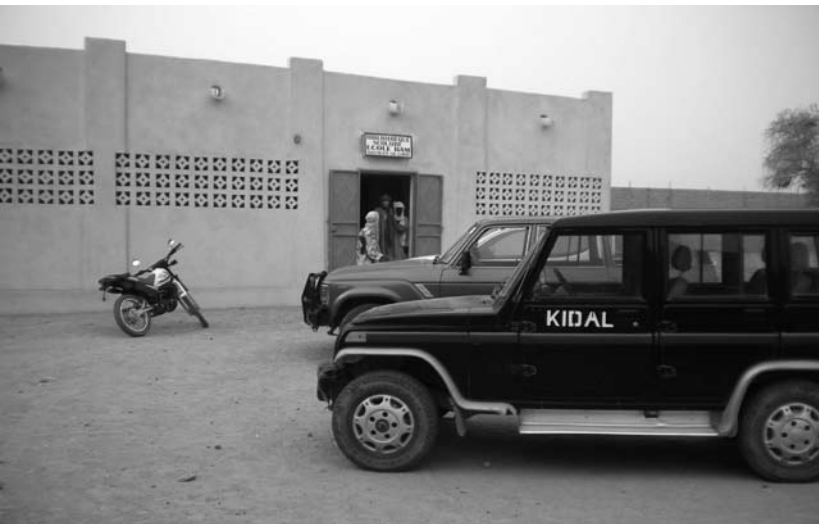
À gauche : Inauguration de la bibliothèque.