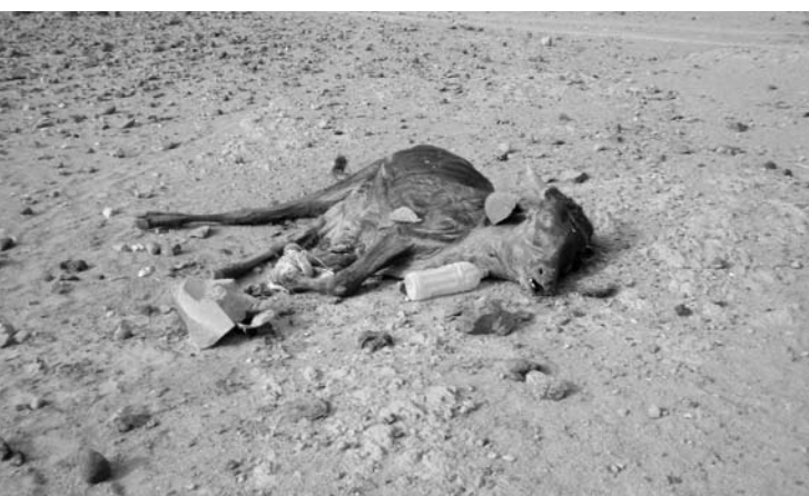
Dégâts de la sécheresse.

(2) Les travaux n'ont commencé qu'en octobre 2010