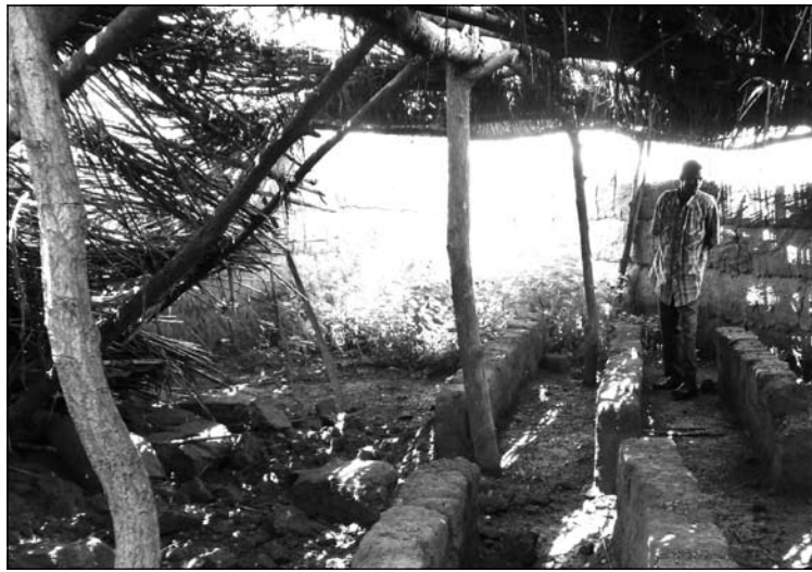
L'école de Moulourou après la pluie.

Il nous faut donc recueillir 25 000 euros pour assurer la construction des 3 classes, les équiper du matériel nécessaire, et prévoir des latrines. Dans une phase ultérieure, mais sans urgence trop marquée, nous aménagerons un point d'eau et un jardin maraîcher, puis trois logements de maîtres comme l'exige l'état burkinabè.