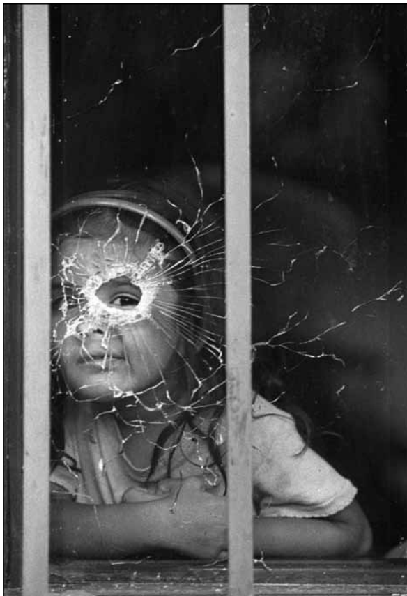
Une écolière de Medellin (Colombie) après le feu croisé entre les forces gouvernementales et les milices urbaines.

Les élèves dont les familles parlent une langue différente de celle qui est enseignée à l'école ne peuvent pas être suivis par leurs parents d'autant que ceux-ci sont généralement analphabètes. C'est le cas dans la majorité des écoles rurales du Burkina.