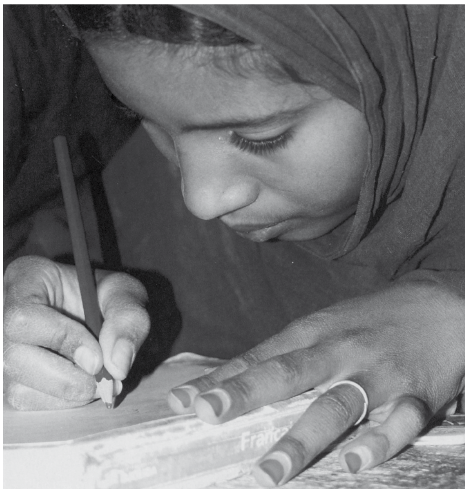
Photo extraite du livre « Enfants des sables » de Moussa et Ibrahim Ag Assarid.

E n 1984, les États-Unis et la Grande-Bretagne quittaient l'UNESCO en provoquant non seulement une crise politique, mais aussi une diminution du 30 % du budget de cette organisation. En même temps, la Banque Mondiale (BM) change les critères de l'aide internationale aux pays endettés et impose, comme condition, la mise en place de politiques d'ajustements structurels. Ceux-ci comportent entre autres une réduction de la dépense publique dans le domaine de l'éducation. Ces pays doivent réduire leurs investissements pour l'université et l'école secondaire et privilégier l'instruction de base y compris les programmes d'alphabétisation. Ces politiques sont contraires à celles préconisées par l'UNESCO : l'éducation est un droit et le système scolaire est un tout dans lequel chaque niveau est dépendant de l'autre et où l'État national joue un rôle de planification et de développement.