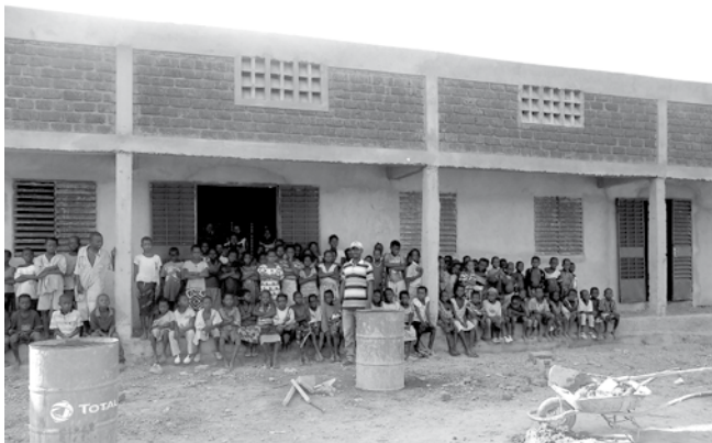
L'école de Moulourou au 31 octobre 2011.