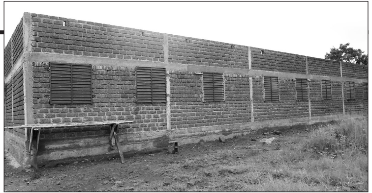
L'école en construction.