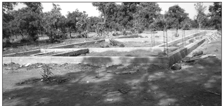
Soubassement de l'école de Moulourou.

L'équipe du GTMC qui a effectué une mission sur place début 2011 en a présenté un compte-rendu le 2 mai à Clamart. Tous les sujets importants ont pu être évoqués et la séance de questions / réponses a été jugée très intéressante. Deux points ont fait l'objet de développements particuliers. D'abord, le « pro-