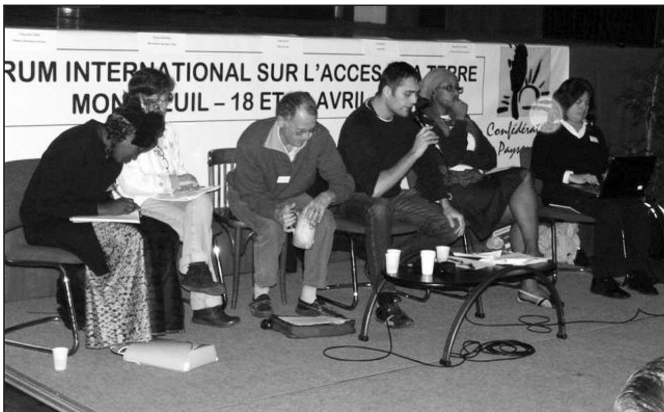
Montreuil : forum international sur l'accès à la terre organisé par Peuples Solidaires et la Confédération Paysanne en avril 2009 ».

Peuples Solidaires a une double origine : deux initiatives de l'abbé Pierre.