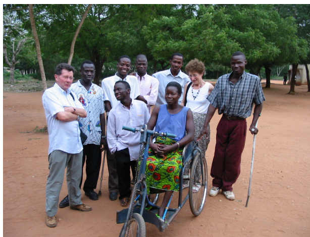
Jeunes handicapés du Centre D. Orione à Bombouaka au Togo

Utiliser les moyens mis par la fédération nationale à la disposition des groupes.