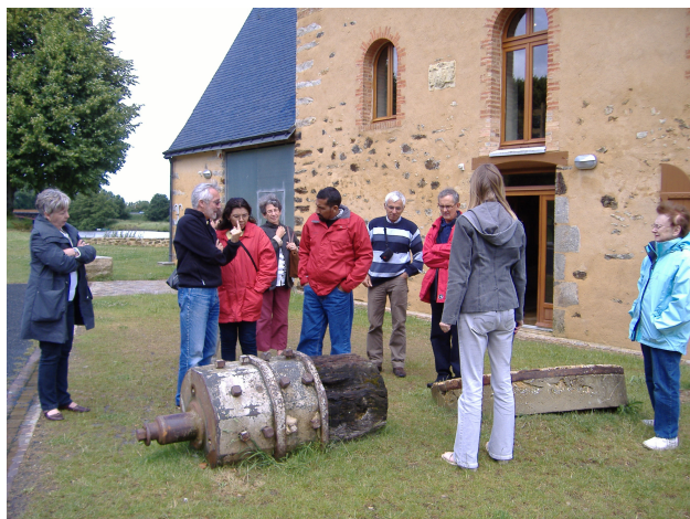
Visite de partenaires nicaraguayens en Sarthe en juin 2009